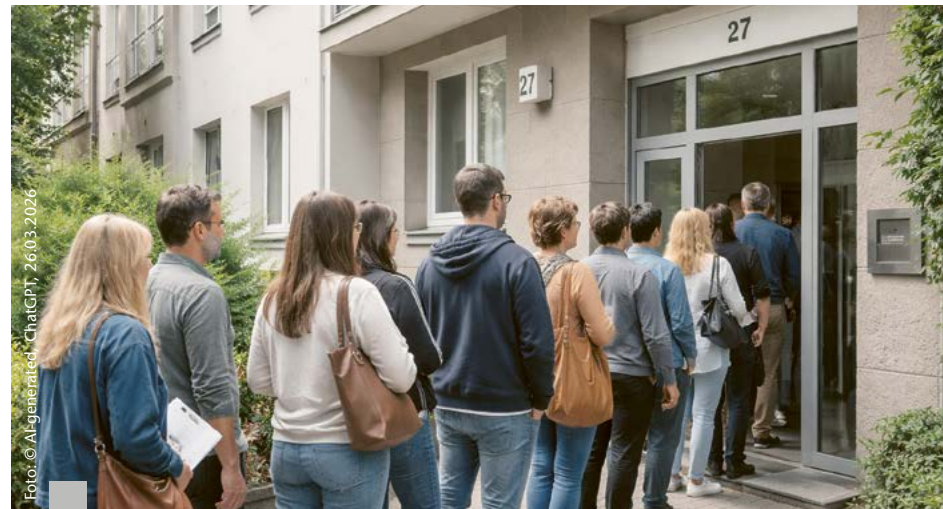
Betroffen von der Wohnungsnot sind vor allem Großstädte, in denen die Mietpreismbremse gilt. Diese verursacht eine Verlagerung von Wohnungsangeboten in weniger regulierte Marktsegmente.

Der Wohnungsbestand in Deutschland ist auf einen Tiefststand zusammengeschrumpft. Wohnungssuchende haben es aktuell schwer. Das klassische Angebot geht zurück, die Preise steigen und die Konditionen werden über immer mehr befristete Verträge oder möblierte Angebote härter. Die Studie „Sozialer Wohn-Monitor 2026“ des Pestel-Instituts rückt den Wohnungsmangel in den Fokus und benennt die Verlierer: Auszubildende, Studierende und immer mehr ältere Menschen mit Armutsrenten. Der GREIX-Mietpreisindex kommt zu ähnlichen Ergebnissen: Demnach stiegen die Angebotsmieten in deutschen Städten zum Jahresende 2025 schneller als die allgemeine Teuerung. Im Quartalsvergleich stiegen die Mieten im bundesweiten Durchschnitt um 1,0 Prozent, im Jahresvergleich sogar um 4,5 Prozent. Die Anzahl der Wohnungsinserate ging deutlich zurück. Der Anteil befristeter und möblierter Mietangebote erreichte ein Rekordniveau. Bundesweit entfielen im Jahr 2025 inzwischen mehr als 17 Prozent aller Inserate auf dieses Segment, also mehr als jedes sechste.