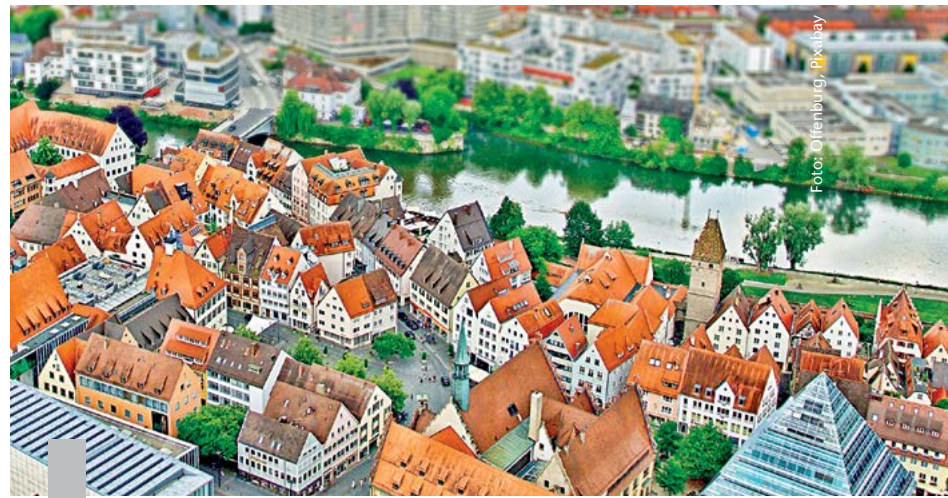
Die Inflation ist so hoch wie seit 40 Jahren nicht mehr. Immobilien können in dieser Zeit als Schutz vor Inflation dienen.

Der Markt für Immobilien erlebt einen deutlichen Wandel. Nach der rund zehn Jahre andauernden Niedrigzinsphase, in der die Preise für Immobilien unaufhörlich stiegen, beginnt jetzt eine neue Wirtschaftsphase. Sie bringt Änderungen für Eigentümer und Mietende, für Kaufinteressierte und Verkaufende mit sich. Immobilienfachleute sehen die Zukunft für Immobilienbesitzer optimistisch: Starke Wohnungsmärkte bleiben stark. Der Wandel vollzieht sich in ganz Europa. Während die Zahl der Immobilienveräußerungen in Deutschland, Irland, den Niederlanden und Schweden im zweiten Quartal zurückging, war in Großbritannien, Dänemark und Spanien ein deutlicher Anstieg der Marktaktivität zu verzeichnen. Wie ein Wandel des Marktes sich auf sehr drastische Weise vollziehen kann, ist gerade in Australien und Neuseeland zu beobachten. Das Handelsblatt berichtet, dass dort die Preise so stark einbrechen, wie nirgendwo sonst auf der Welt. Die Fachleute erwarten für Deutschland ein sich stabilisierendes Preisniveau und deutlich steigende Mieten.