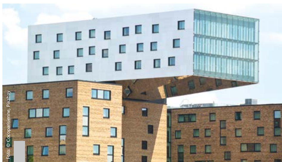
Der deutsche Immobilienmarkt durchschreitet die Talsohle und erholt sich langsam.

Die Preise für Wohnimmobilien in Deutschland sind im dritten Quartal 2023 im Vergleich zum Vorjahresquartal um durchschnittlich 10,2 Prozent gesunken. Wie das Statistische Bundesamt mitteilt, ist dies der stärkste Rückgang der Wohnimmobilienpreise gegenüber einem Vorjahresquartal seit Beginn der Zeitreihe im Jahr 2000. Diese Meldung ist für viele Interessenten ein Signal. Denn gleichzeitig steigen die Mieten auf Rekordniveau. Der Anstieg der Mieten in den Metropolen ist zweistellig: In Berlin liegt er für Neubauten bei 20 Prozent, in Stuttgart bei 14,6 Prozent, in Köln bei 14,1 Prozent und in München bei 12,8 Prozent. Nach einem Jahr der Zurückhaltung zeigt das ImmoScout24-WohnBarometer einen deutlichen Aufwärtstrend bei den Angebotspreisen im Neubaubereich. Auch bei Bestandsimmobilien ist der Trend positiv. Noch ist ein Angebotsüberhang im Markt, der sich aber sukzessive abbauen wird. Es ist nicht zu erwarten, dass die Preise noch einmal so stark fallen wie im vergangenen Jahr.