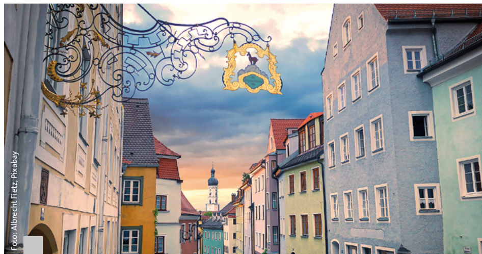
Dem größer gewordenen Immobilienangebot steht eine stark gebremste Nachfrage gegenüber. Das grundsätzliche Interesse an Immobilien bleibt jedoch ungebrochen.

Die außergewöhnlichen Ereignisse der vergangenen Jahre haben Spuren auf dem Immobilienmarkt hinterlassen: Das Angebot an Wohnimmobilien zum Kauf steigt deutlich. Immobilieninteressenten zeigen dagegen eine gewisse Kaufzurückhaltung. Wichtige Ursachen für die Verschiebungen auf dem Immobilienmarkt sind die stark gestiegenen Zinsen und die inflationsbedingt hohen Lebenshaltungs- und Energiekosten. Die Präferenzen beim Immobilienkauf haben sich deutlich verändert. Das wichtigste Kriterium bei der Immobiliensuche ist jetzt der Preis und nicht mehr die Lage. Vor der Pandemie suchten die meisten Kaufinteressenten Immobilien in der Stadt. Seit der Pandemie ist das Umland die begehrteste Region bei der Immobiliensuche geworden. Auch das Interesse nach Wohneigentum auf dem Land ist gestiegen. Kaufinteressenten und Verkaufende sind inzwischen zunehmend zu Kompromissen und Abstrichen bereit. Verkaufsverhandlungen verlaufen zäher, besonders wenn es um nicht oder nur unzureichend sanierte Altbauten geht.